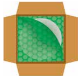
Lege ruimtes opvullen